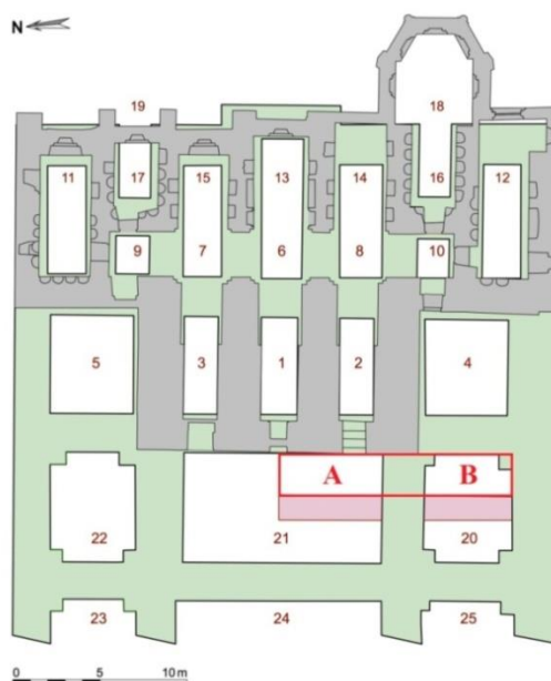
Fig. 1 : Saint-Médard de Soissons. Fouille programmée 2020 en A et B.