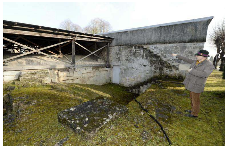
Une toiture provisoire, installée au début des années 90, protège la crypte des intempéries.

C'est l'année du début du renouveau pour la crypte Saint-Médard. L'association se fixe pour première mission de la protéger et de la faire connaître aux habitants de la ville.