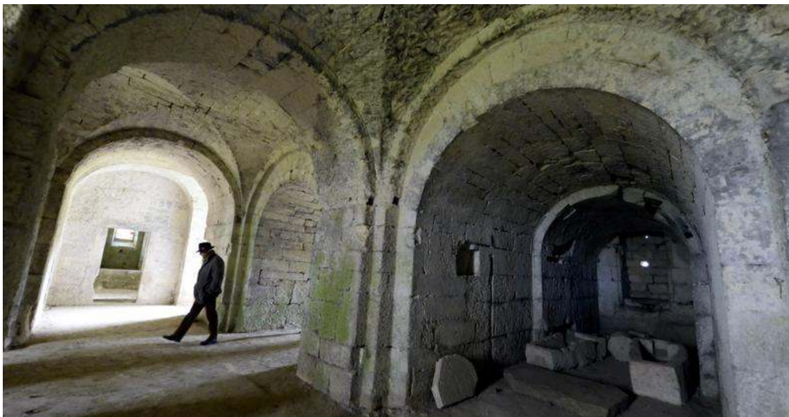
Protéger les vestiges et faire connaître l'histoire de l'abbaye Saint-Médard, c'est l'objectif de l'association.

Il ne reste pas grand chose de l'abbaye qui a traversé les siècles. Sauf la crypte. Une association veut valoriser ce berceau de l'histoire de France.