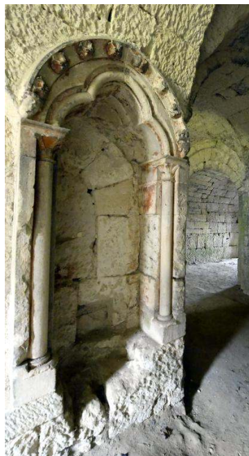
Au moyen-âge, la crypte était entièrement peinte.